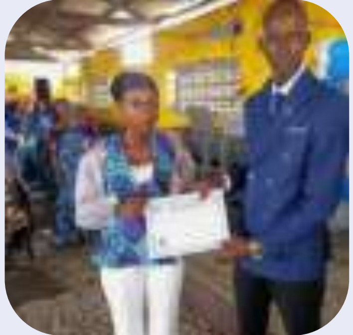
Remise de brevet à l'apprenante de l'esthétique à Camp Luka

Le projet était financé par Humana People to People Deutschland (avec financement du Gouvernement Allemand).