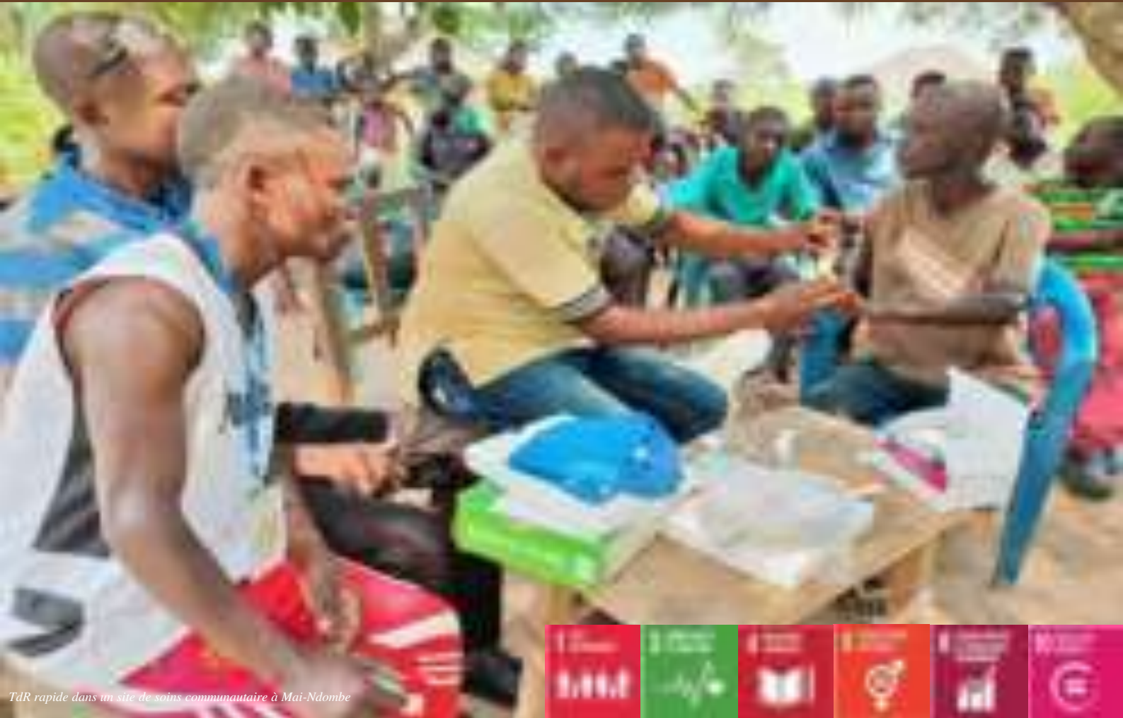
TdR rapide dans un site de soins communautaire à Mai-Ndombe