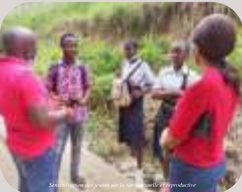
Sensibilisation des jeunes sur la santé sexuelle et reproductive

Dans ce rapport, vous découvrirez comment nos programmes contribuent à créer une vie meilleure ici et maintenant, avec de l'espoir et de la force, et en se tournant dans l'avenir.