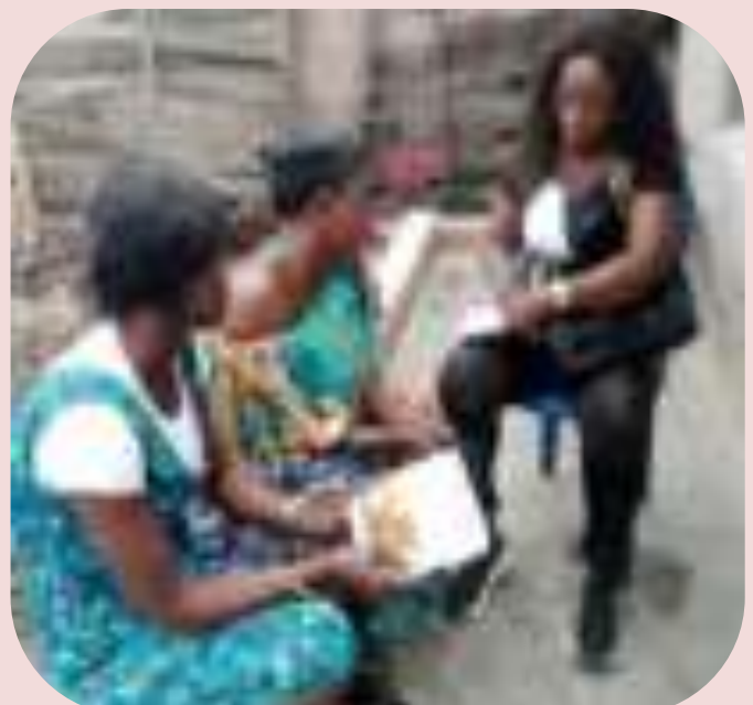
Suivi des bénéficiaire de cash transfert par l'officier de terrain à Matete/Kinshasa