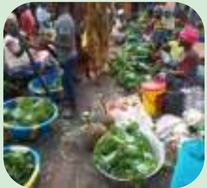
Vente des légumes produits par les fermiers à Dongo

Ce projet est financé par l'ONG Allemande Sign of Hope avec les fonds du Ministère Fédéral Allemand de la Coopération Economique et du Développement (BMZ).