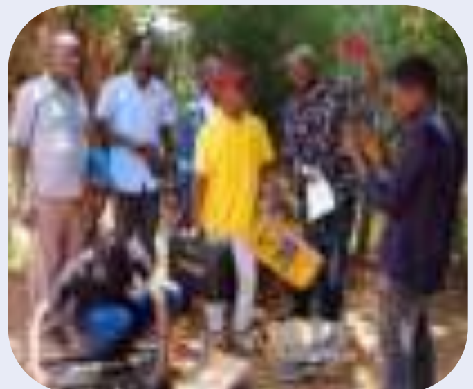
Dotation de kit aux apprenants lauréats à Kasenga