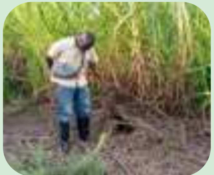
Plantation des cannes à éléphant à Lukala