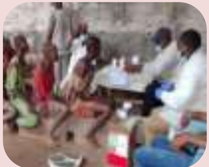
Dépistage de TB dans la prison au Mai-Ndombe/Zs Oshwe