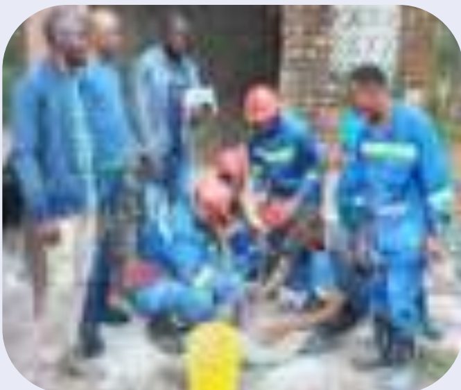
Mélange d'aliments pour les porcs par les jeunes lauréats / Ferme LUGO FARM

Le projet était financé par ENABEL dans le programme EDU-KAT.