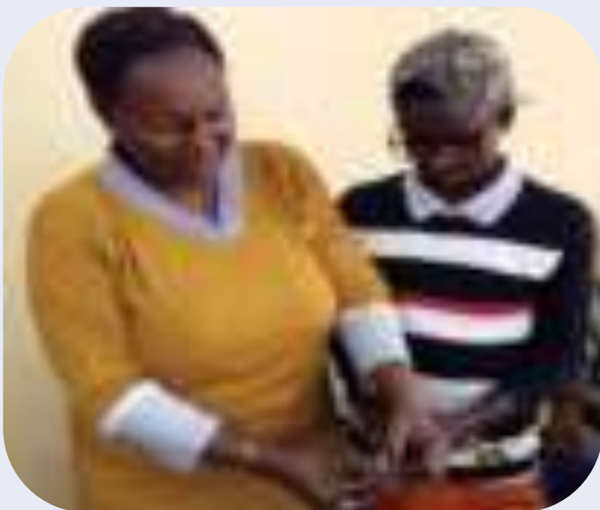
Démonstration de l'utilisation correcte de préservation à Mont Ngafula

Le projet était financé par la cité de Vienne à travers Humana Autriche.