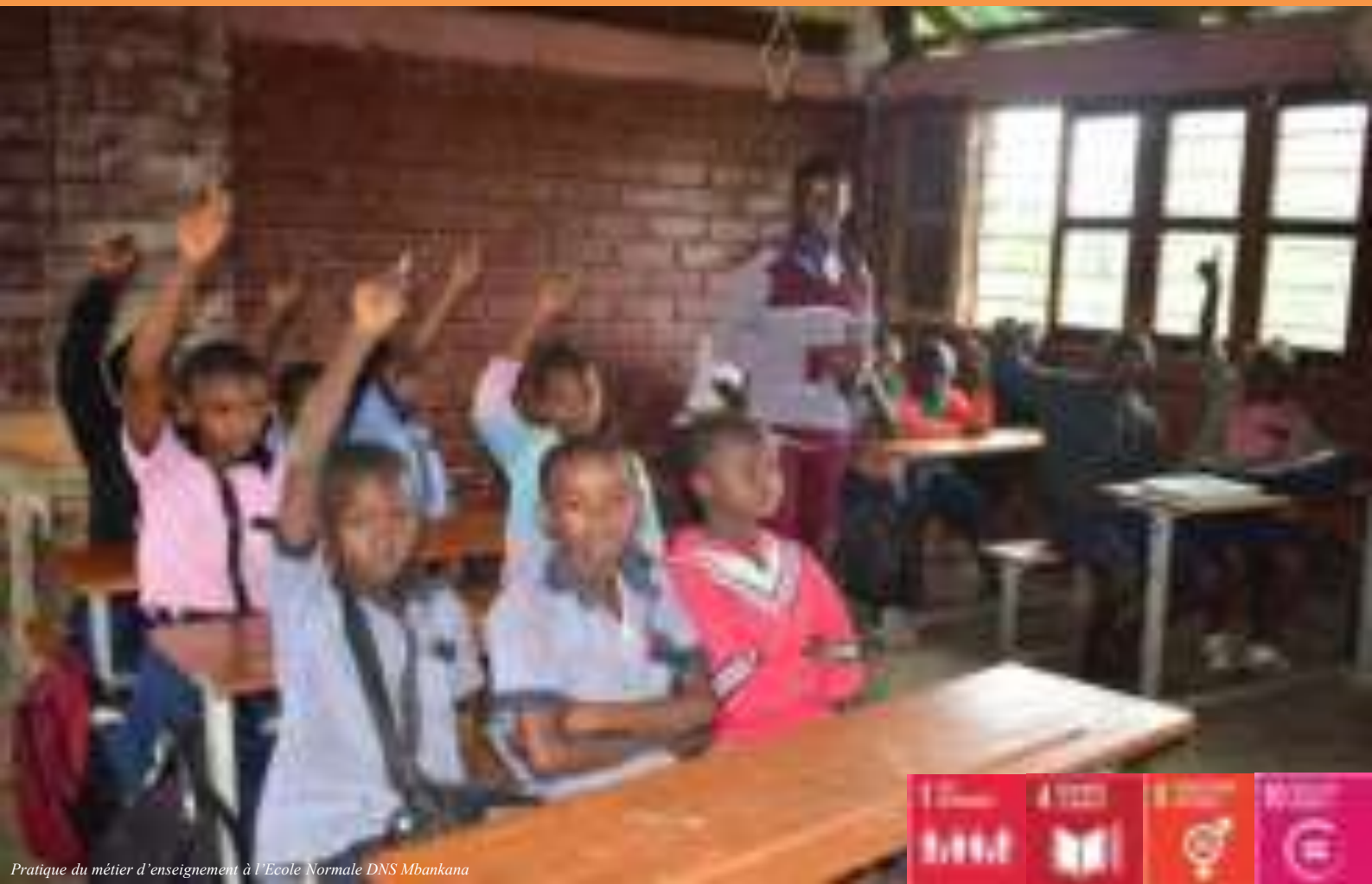
Pratique du métier d'enseignement à l'Ecole Normale DNS Mbankana