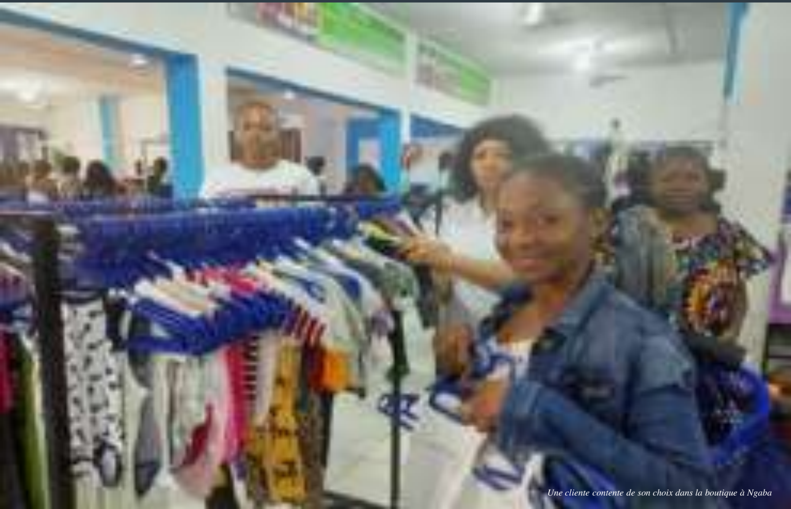
Une cliente contente de son choix dans la boutique à Ngaba

En achetant au moins un article dans les boutiques de HPP-Congo, vous contribuez au développement de votre pays et à la réduction de l'impact négatif de l'industrie de la mode et du textile sur l'environnement.