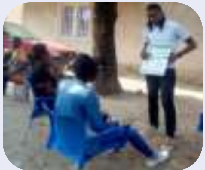
Campagne porte à porte sur les méthodes contraceptives à utiliser à Mont Ngafula