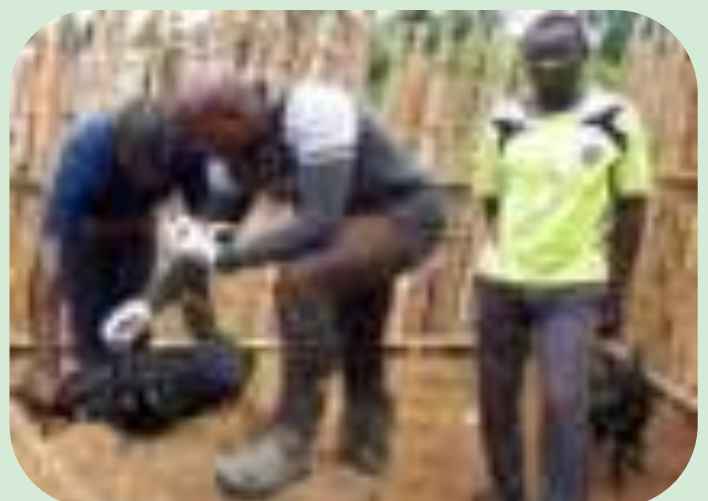
Les boucs améliorateurs introduits par le projet