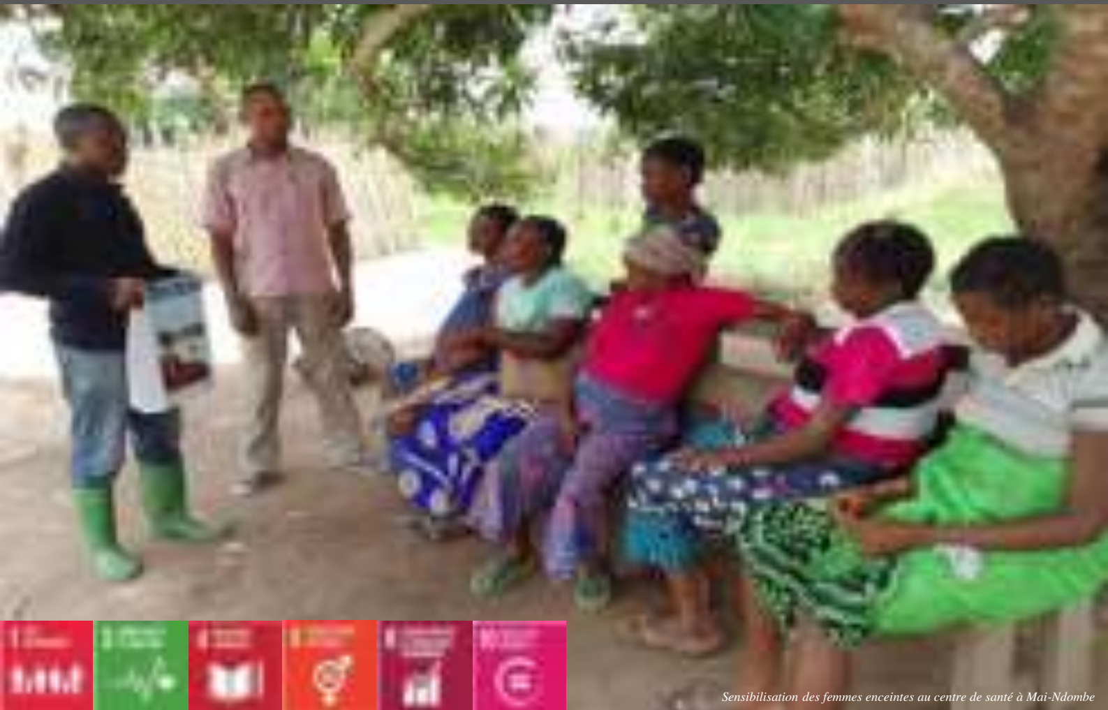
Sensibilisation des femmes enceintes au centre de santé à Mai-Ndombe