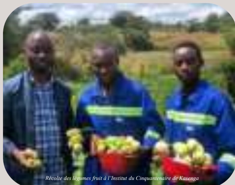
Récolte des légumes fruit à l'Institut du Cinquantenaire de Kasenga