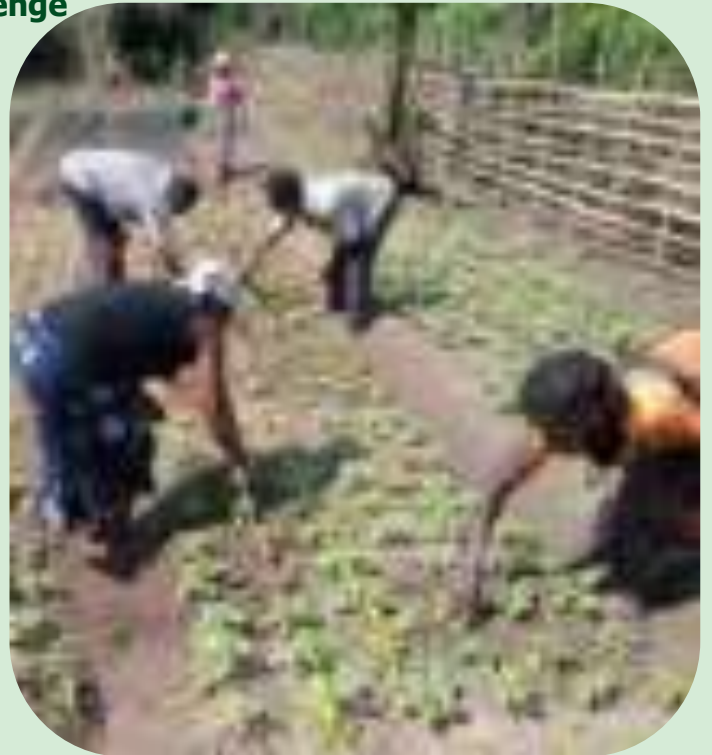
Entretien d'un champ de démonstration à Libenge

Ce projet était financé par l'Ambassade des Etats Unis soutenu par des fonds propres de HPP-Congo.