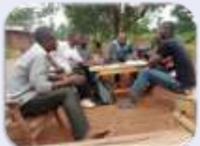
Résolution pacifique de conflit entre les réfugiés et les autochtones à Libenge

Ce projet a été financé par IFA/Ministère Fédéral Allemand des Affaires Etrangère.