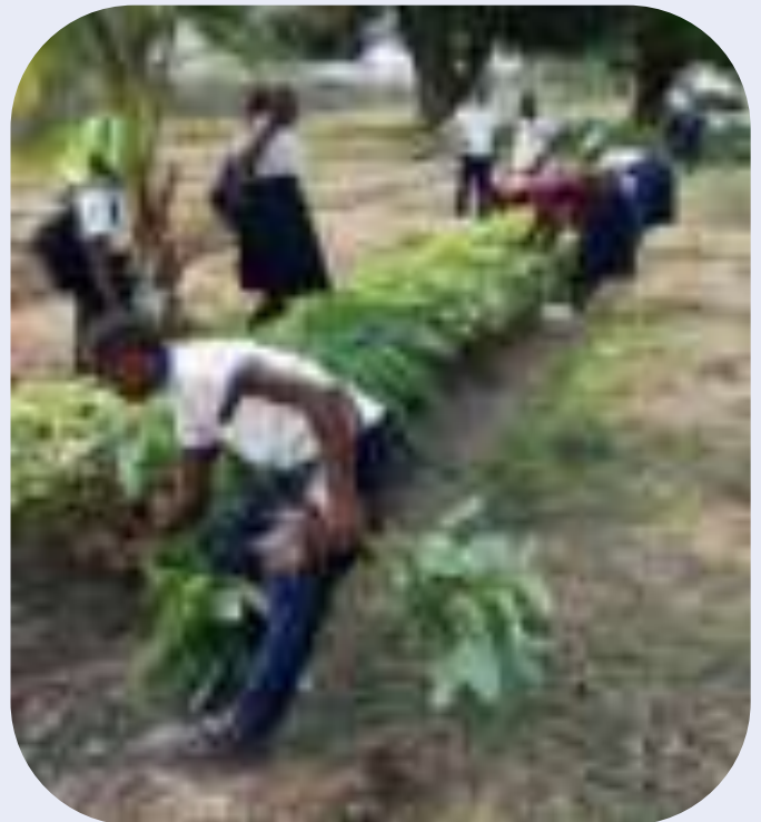
Les élèves de l'ITA SIMISIMI dans leur jardin de démonstration

Le projet était financé par ENABEL dans le programme EDUT.