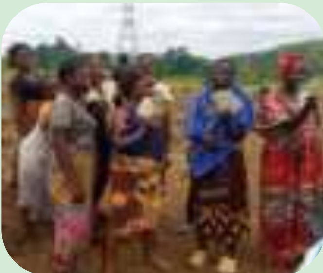
Les prestataires contentes de recevoir leur argent

Ce projet est financé par la cimenterie de Lukala (CILU).