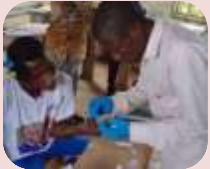
TdR rapide dans un site de soins communautaire à Mai-Ndombe