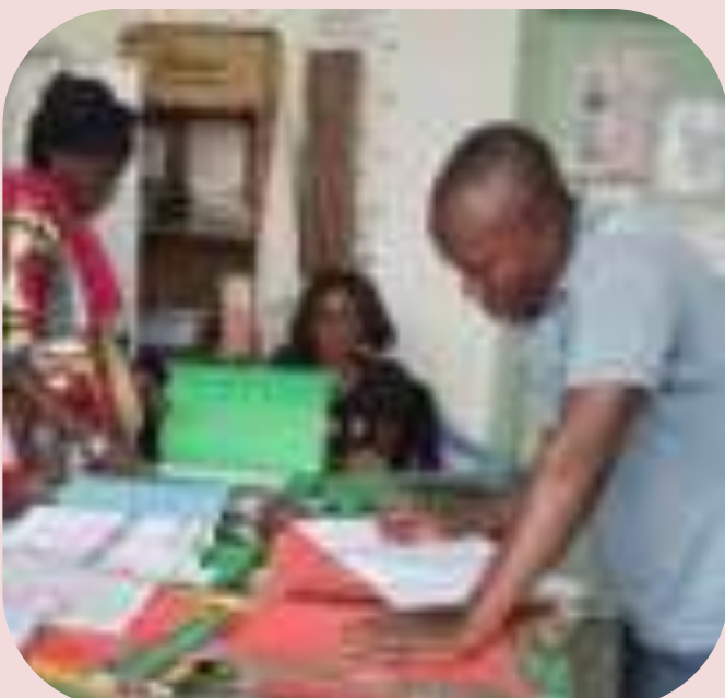
Remplissage des fiches de patient au centre de santé/Mont-Ngafula